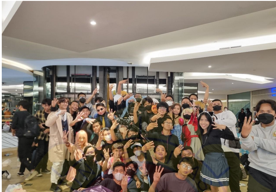
Gambar 2. Dokumentasi observasi lokasi fx Sudirman