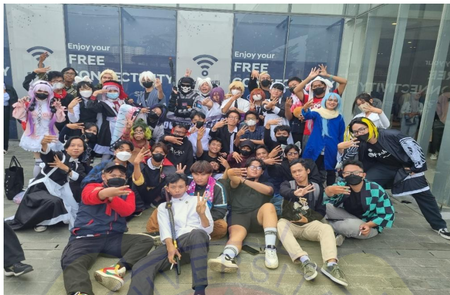
Gambar 4. Dokumentasi observasi lokasi Senayan park (SPARK)