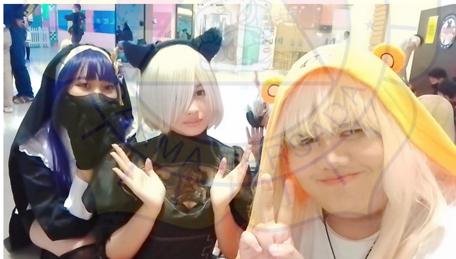
Gambar 3. Dokumentasi Bersama member aktif wanita atsumaru