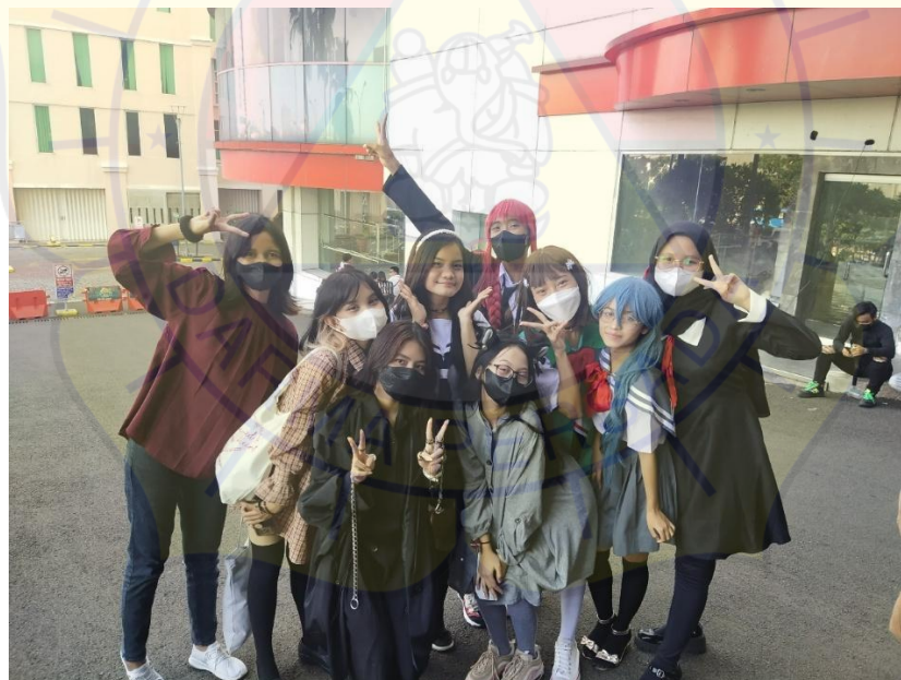
Gambar 5. Dokumentasi observasi Bersama member akti wanita atsumaru