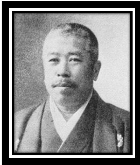
Potret Shiga Shigetaka