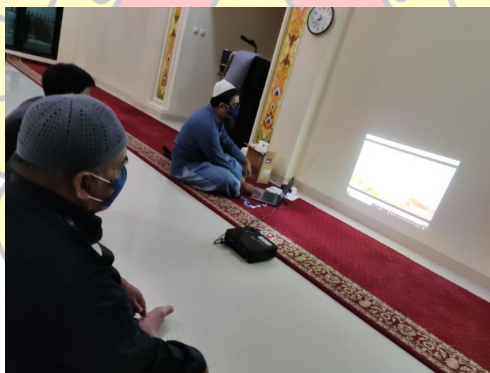
Gbr. Dokumentasi Kegiatan 2