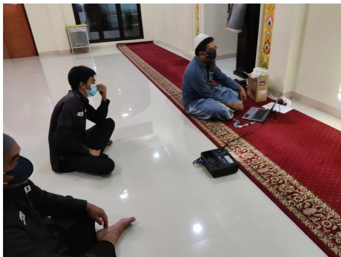
Gbr. Dokumentasi Kegiatan 1