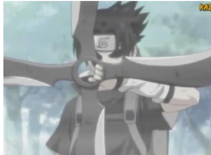
Gambar 4 : Contoh Fuuma Shuriken dalam anime Naruto