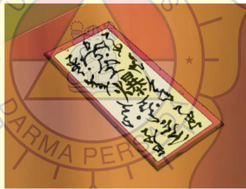
Gambar 6 : Contoh gambar Kibaku fuda pada anime Naruto