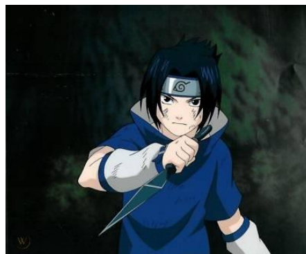
Gambar 5 : Contoh kunai dalam anime Naruto