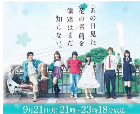
Gambar 1: Contoh Live Action dari anime Anohana