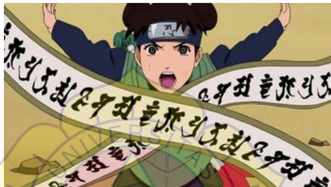
Gambar 7 : Contoh gambar makimono pada anime Naruto