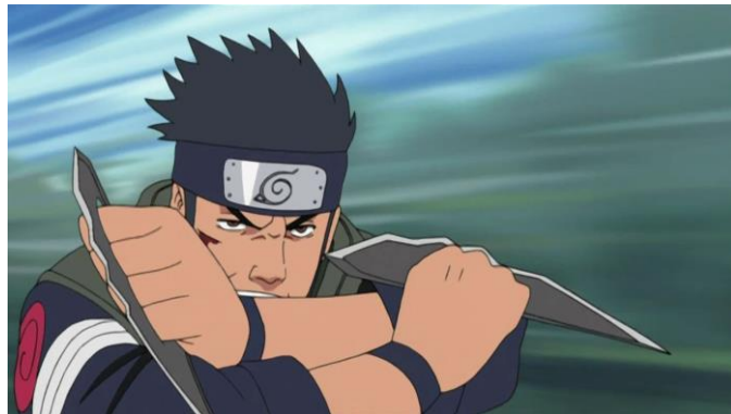
Gambar 9 : Contoh pisai chakura to pada anime Naruto