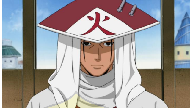
Gambar 3 : Hokage pertama Hashirama Senju dalam anime Naruto