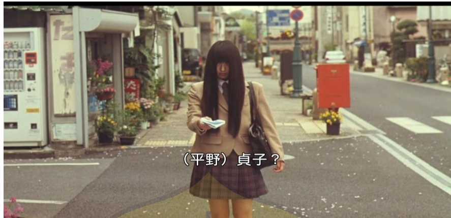
(Gambar 1. Penampilan Sawako yang terlihat mirip Sadako)