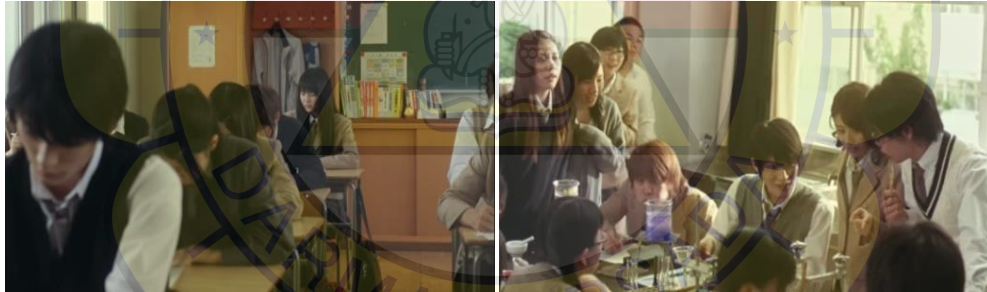
(Gambar 26&27. Kegiatan belajar mengajar di dalam kelas dan lab)