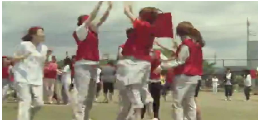
(Gambar 30. Kegembiraan siswa-siswa saat memenangkan lomba)