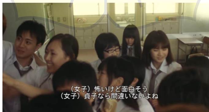
(Gambar 35. Siswa-siswa yang sedang melihat pengumuman)