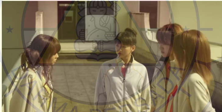
(Gambar 11. Kurumi sedang terpojokkan oleh Sawako, Yoshida dan Yano)