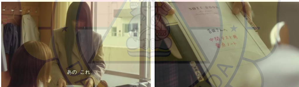
(Gambar 33&34. Sawako memberikan buku catatan kepada Yano)