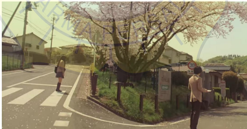
(Gambar 6. Sawako melihat Kazehaya untuk pertama kalinya)