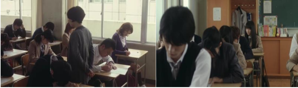
(Gambar 15&16. Suasana Ujian di dalam kelas)