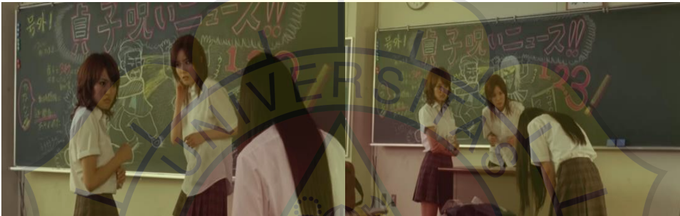
(Gambar 17&18. Sawako meminta bantuan Yoshida dan Yano)