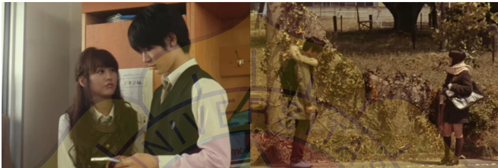
(Gambar 24 & 25. Contoh seragam musim semi di Jepang)