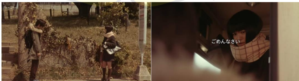
Gambar 12&13. Kazehaya mengantarkan Sawako pulang)