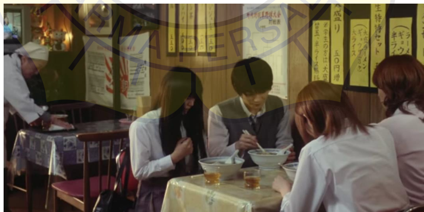
(Gambar 22. Sawako, Kazehaya, Yoshida dan Yano di restoran ramen)