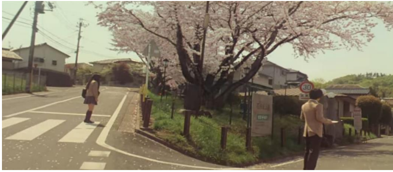
(Gambar 23. Terlihat pohon sakura di persimpangan jalan)