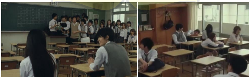
(Gambar 28&29. Kazehaya memilih untuk duduk disamping Sawako)