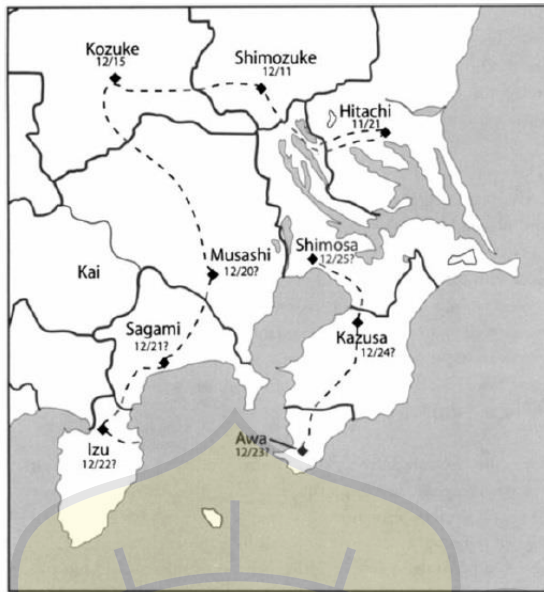
Gambar 3. Peta Pemberontakan Taira no Masakado di wilayah Kanto

Setelah mengambil alih provinsi Hitachi, Masakado memulai rencana pemberontakannya di wilayah Kanto dari provinsi Shimosuke hingga destinasi terakhirnya, yaitu provinsi Shimosa.