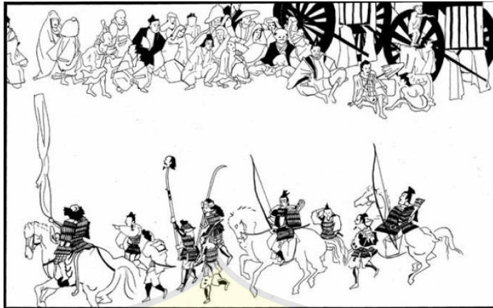
Gambar 5. Rombongan Taira no Sadamori dan Fujiwara no Hidesato Berpawai di Jalanan Kota Tokyo

Gambar tersebut menunjukkan pawai yang dilaksanakan oleh rombongan Sadamori dan Hidesato bersama para utusan dari Kantor Kepolisian Kekaisaran ( Kebiishi-cho ). Terlihat kepala Masakado ditancap di ujung tombak dan menjadi tontonan penduduk kota Kyoto