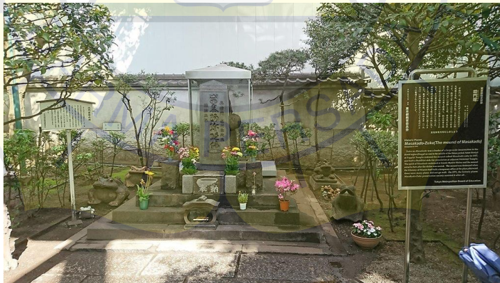
Gambar 6. Kubizuka atau Makam Taira no Masakado

Gambar tersebut menunjukkan makam Masakado yang dinamai “ Kubizuka ” dan terletak di distrik Otemachi