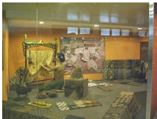
Gambar 2.10 Diorama membuat batik.

Dilantai ketiga bertemakan Seni dan Kriya. Diruang pamer ini menampilkan seni dan kerajinan tradisional masyarakat Indonesia. Benda-benda seni hasil karya bangsa Indonesia dalam bentuk kain tenun ikat dan songket, batik, kerajinan perak, kuningan, tembaga, kayu, dan keramik. Di lantai ini menampilkan juga berbagai jenis perhiasan, senjata tajam dan juga mata uang logam dan kertas yang pernah beredar di Indonesia. Pada bagian tengah terdapat koleksi benda seni utama di lantai ketiga adalah ukiran kayu yang sangat besar berbentuk Kalpataru, pohon hayat.