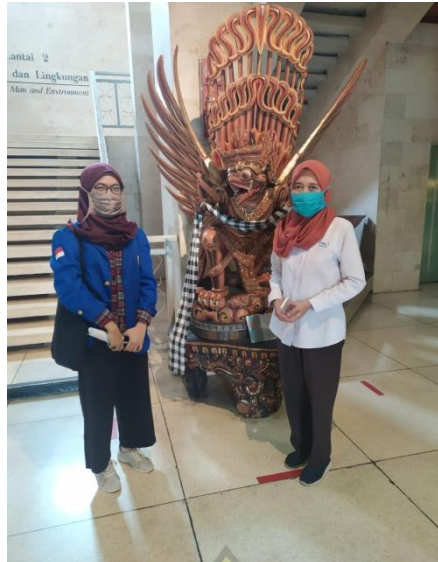
Gambar 2.17 Penulis bersama Ketua Museum Indonesia