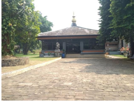
Gambar 2.16 Balai Panjang.

Menurut Ibu Suci Ketua Museum Indonesia, museum ini sering dikunjungi oleh wisatawan lokal maupun mancanegara, baik pelajar, dan mahasiswa. Di Museum Indonesia memiliki empat orang pemandu wisata dengan sebutan educator . Karena mengedukasi untuk pengetahuan khusus tentang kekayaan seni dan budaya dari berbagai daerah di Indonesia. Setiap rombongan pengunjung sekitar 30-40 orang terdapat 1 educator . Koleksi-koleksi yang ada di Museum Indonesia sangat terawat karena setiap hari perawatannya koleksinya dua kali dalam seminggu. Bangunan juga masih asli dan tidak pernah renovasi hanya kerusakan seperti kebocoran dan fitrine yang rusak diperbaiki. Sekitar di tahun 2025 Museum Indonesia akan menjadi Cagar Budaya. Fasilitas di Museum bisa disewakan untuk kegiatan umum. Selama pandemi virus corona di area Museum Indonesia harus mengikuti peraturan yang diterapkan seperti memakai masker, menjaga jarak, memakai handsanitizer atau mencuci tangan dan tidak boleh melepas masker saat di area Museum, dan ada sanksinya. Kendala di Museum Indonesia pegawai yang datang 50% yang datang dan penurunan gaji pada pegawai. .