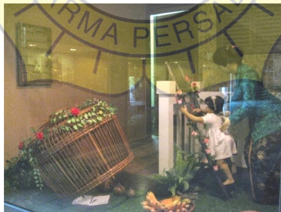
Gambar 2.7 Upacara turun tanah untuk bayi.

Di lantai kedua bertemakan Manusia dan Lingkungan. Diruang pameran ini memperlihatkan koleksi-koleksi yang berkaitan dengan kehidupan sehari-hari. Bertujuan untuk menjelaskan mengenai interaksi masyarakat Indonesia dengan alam dan lingkungannya. Koleksinya ada berbagai rumah miniatur rumah tradisional, tempat peribadatan, alat transportasi darat & air, ruangan khas dari masing-masing daerah, alat kerajinan tangan, perabotan rumah tangga. Beberapa diorama menampilkan upacara adat menyangkut daur hidup manusia, seperti upacara Mitoni (nujuh bulanan), Turun Tanah (upacara untuk bayi), Khitanan , Mapedes (upacara potong gigi masyarakat Bali), upacara pelantikan Datuk, dan Pelaminan Minangkabau.