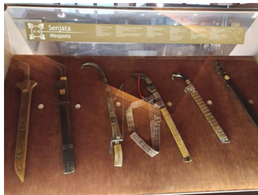
Gambar 2.11 Senjata.