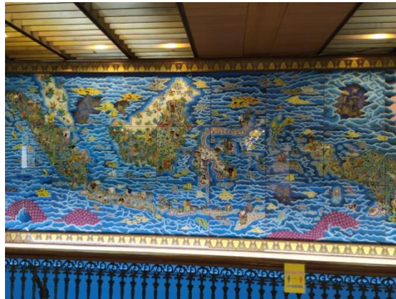
Gambar 2.6 Peta Indonesia.

menonjolkan unsur air dan bumi, biasa disebut ibu pertiwi. Keduanya melambangkan perpaduan keseimbangan gerak alam yang saling bertentangan namun tak terpisahkan.