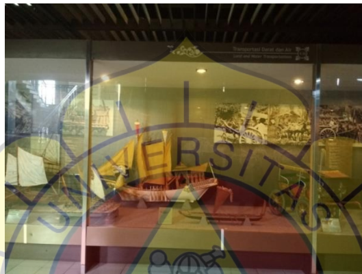
Gambar 2.9 Alat transportasi air dan darat.

Dilantai ketiga bertemakan Seni dan Kriya. Diruang pamer ini menampilkan seni dan kerajinan tradisional masyarakat Indonesia. Benda-benda seni hasil karya bangsa Indonesia dalam bentuk kain tenun ikat dan songket, batik, kerajinan perak, kuningan, tembaga, kayu, dan keramik. Di lantai ini menampilkan juga berbagai jenis perhiasan, senjata tajam dan juga mata uang logam dan kertas yang pernah beredar di Indonesia. Pada bagian tengah terdapat koleksi benda seni utama di lantai ketiga adalah ukiran kayu yang sangat besar berbentuk Kalpataru, pohon hayat.