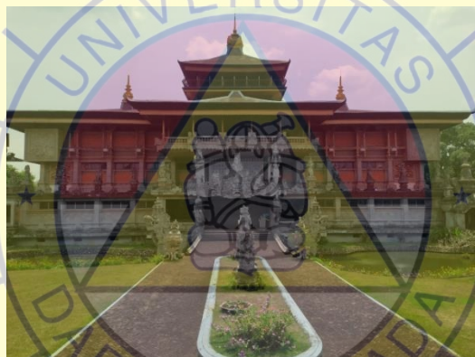
Gambar 2.2 Bangunan Museum Indonesia.