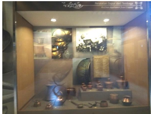
Gambar 2.8 Peralatan dapur dari tembaga.