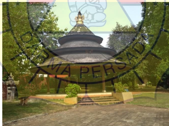
Gambar 2.15 Balai bundar.