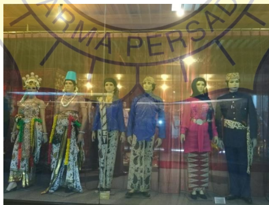
Gambar 2.5 Pakaian adat Yogyakarta dan Jakarta.

Di lantai yang sama ada lukisan kaca bergambar peta Indonesia.dengan motif batik mega mendung berjudul Citra Indonesia. Lukisan Garuda di sebelah kiri melambangkan dunia atas, menonjolkan unsur udara, awan, dan cahaya, yang disebut bapak angkasa. Naga bersisik kemerahan yang kepalanya di sisi kanan menjadi perlambang dunia bawah,