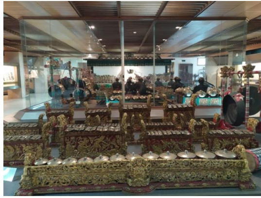
Gambar 2.3 Diorama pertunjukkan wayang.