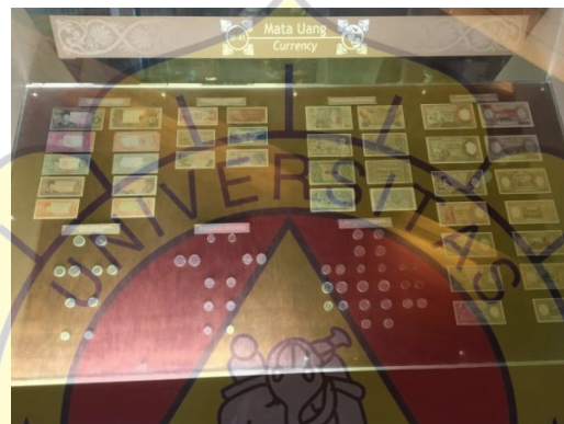
Gambar 2.12 Mata uang.

Ditengah lantai tiga ada ukiran Pohon Hayat atau Pohon Kehidupan dengan berukuran tinggi 8 meter dan lebar 4 meter. Pohon Hayat terbuat dari lempengan tembaga dengan lambangkan alam semesta yang mengandung unsur udara, air, angin, tanah, dan api. Benda seni utama ini menutup pameran di museum ini.