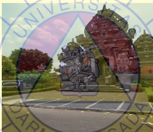
Gambar 2.1 Di depan pintu masuk Museum Indonesia.

Museum Indonesia adalah museum antropologi dan etnologi yang terletak di Jalan Taman Mini Indonesia Indah (TMII), Ceger, Jakarta Timur, Indonesia. Museum Indonesia menampilkan sebuah karya seni dan budaya berbagai suku bangsa yang menghuni Nusantara dan membentuk negara kesatuan Republik Indonesia. Museum ini bergaya arsitektur Bali dan dihiasi beraneka ukiran dan patung Bali. Museum Indonesia menyimpan koleksi beraneka macam seni, kerajinan, pakaian tradisional dan kontemporer dari berbagai daerah di Indonesia.