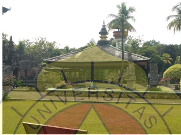
Gambar 2.14 Soko tujuh.

Museum ini menggelar pameran tidak tetap atau sementara dengan tema tertentu, seperti pameran topeng, kain tradisional, senjata tradisional, lukisan, serta peragaan pembuatan seni kerajinan tradisional seperti demonstrasi pembuatan membatik, dan menatah wayang kulit. Selain bangunan utama, di dalam kompleks Museum Indonesia terdapat taman Bali, Bale Panjang, Bale Bundar, dan bangunan Soko Tujuh yang dapat disewakan untuk berbagai keperluan umum.