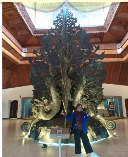
Gambar 2.13 Penulis berfoto di Pohon Hayat.

Ditengah lantai tiga ada ukiran Pohon Hayat atau Pohon Kehidupan dengan berukuran tinggi 8 meter dan lebar 4 meter. Pohon Hayat terbuat dari lempengan tembaga dengan lambangkan alam semesta yang mengandung unsur udara, air, angin, tanah, dan api. Benda seni utama ini menutup pameran di museum ini.