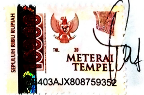
Sinta Yulia Fitri