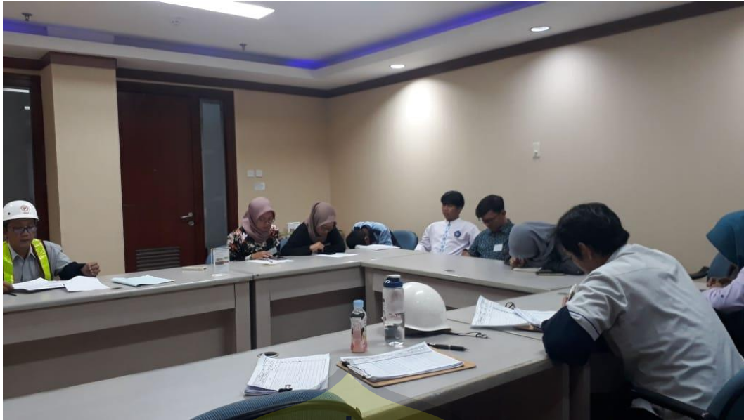
Gambar III. Kegiatan Meeting Koordinasi