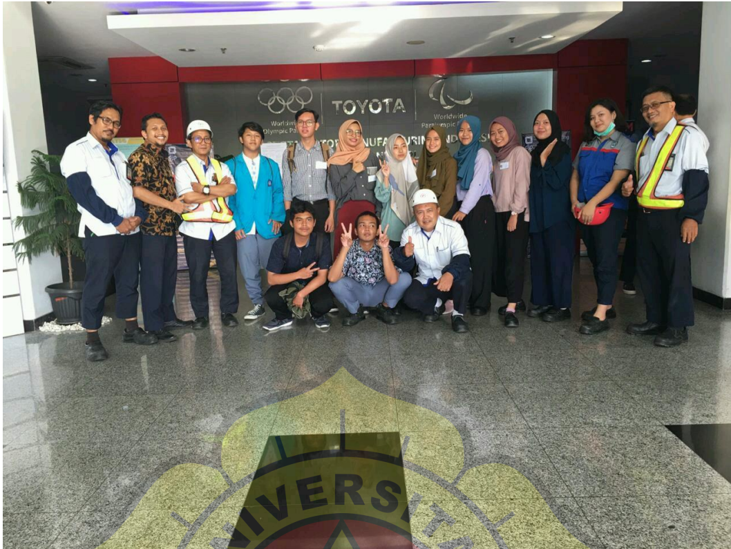
Gambar IV. Perpisahan Peserta PKL dengan Mentor dan Staff Section