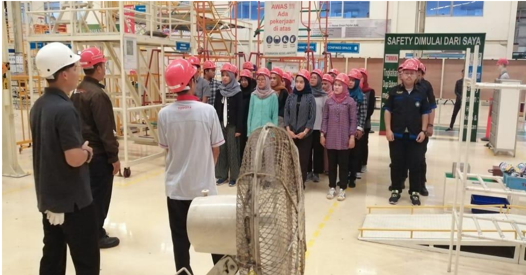
Gambar I. Pelatihan Safety Dojo