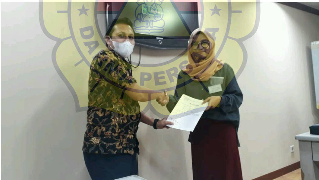
Gambar IV. Pemberian Surat Keterangan Sesudah Praktik Kerja Lapangan (PKL)