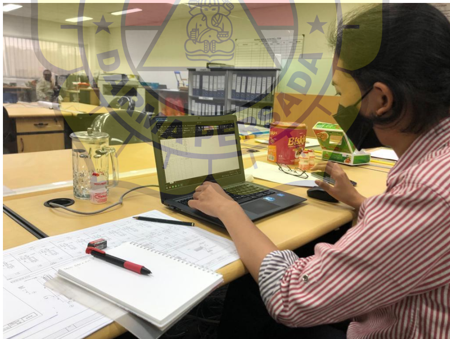
Penulis saat mengerjakan tugas dari Pak Mufti ( Quantity Surveyor )