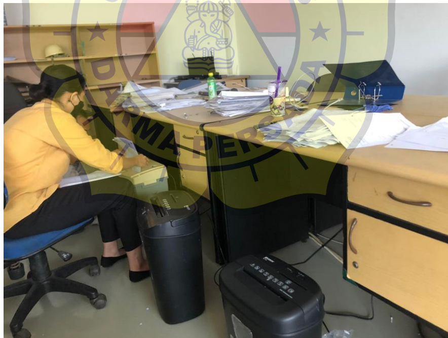
Penulis saat memilah kertas yang tidak terpakai saat membantu pindahan New Site Office PT Takenaka Indonesia proyek Cibitung area