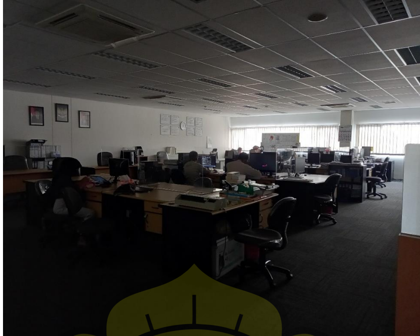
Suasana kantor PT Takenaka Indonesia proyek Cibitung area saat jam istirahat (lampu ruangan dimatikan)