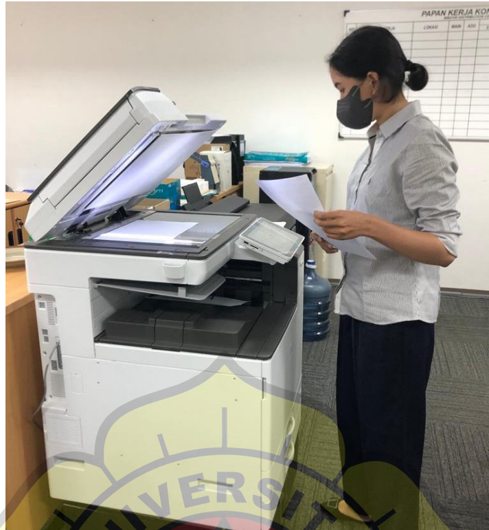
Penulis saat membantu untuk fotocopy file yang dibutuhkan