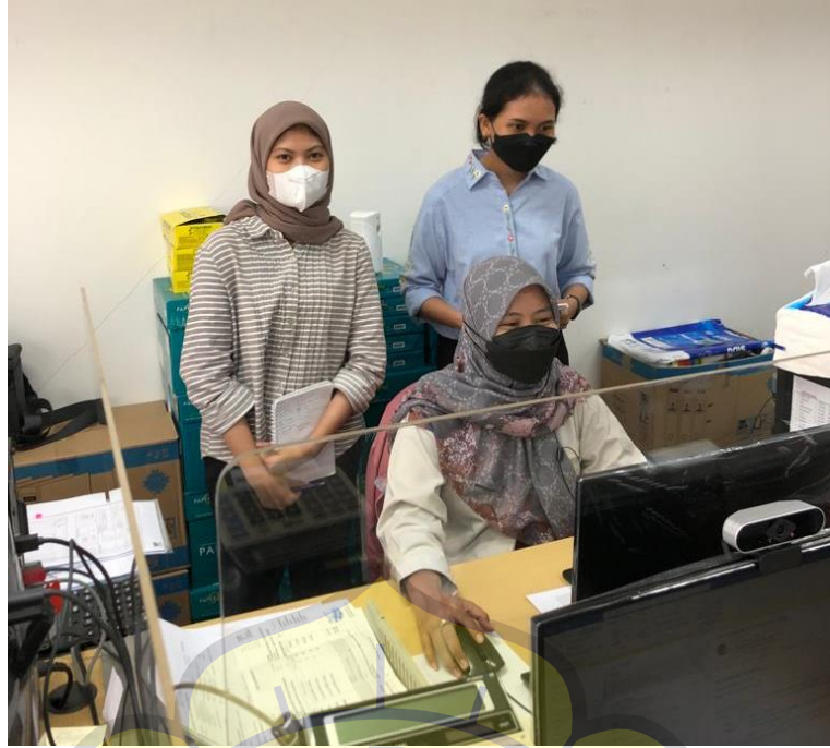
Penulis dan rekan kerja mempelajari bidang Cashier dengan Ibu Tia