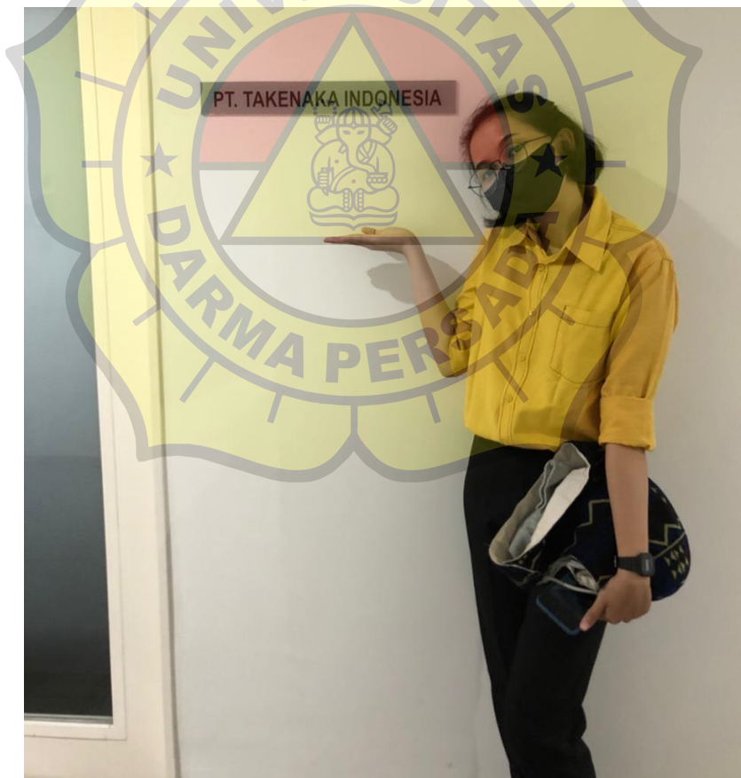
Penulis foto didepan kantor PT Takenaka Indonesia proyek Cibitung area