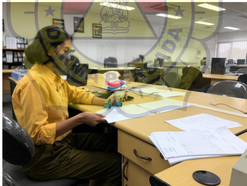
penulis saat membolongi file work of foreman, order sheet, kwitansi untuk dimasukkan kedalam ordner