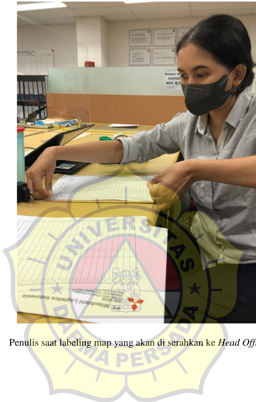
Penulis saat labeling map yang akan di serahkan ke Head Office