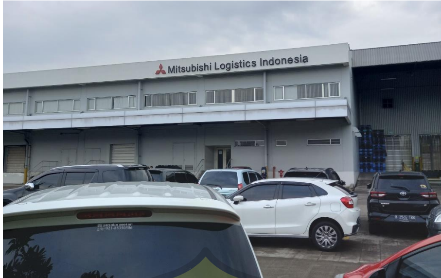
Lokasi PT Takenaka Indonesia berada di warehouse Mitshubishi Logistics Indonesia Cibitung area