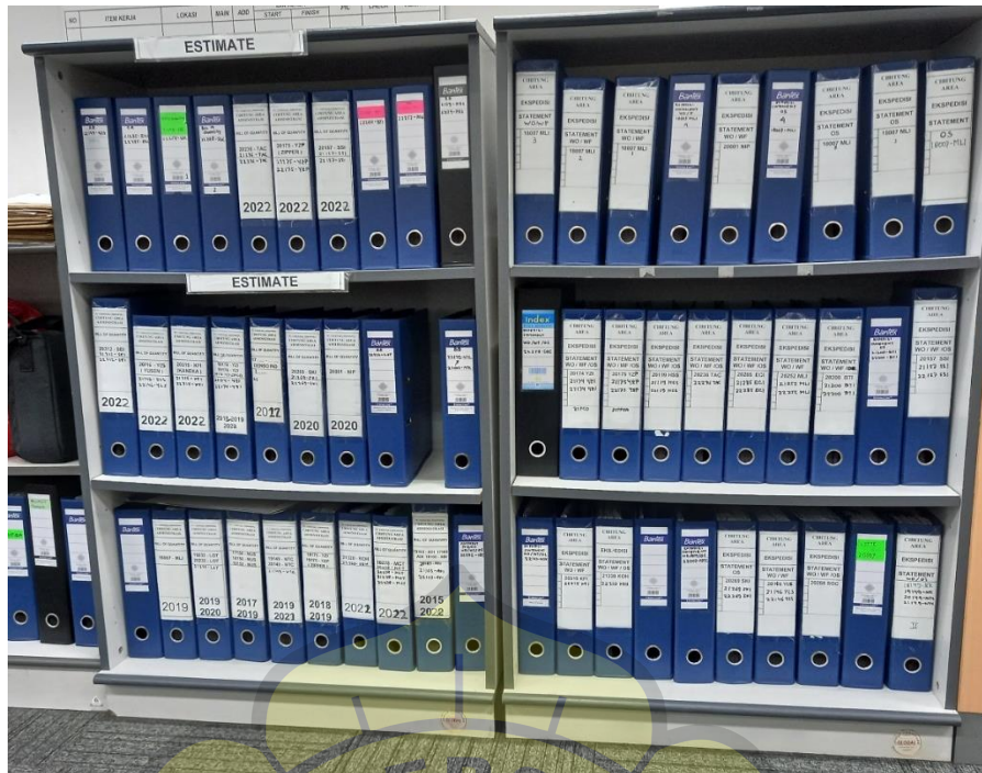
Archive ordner Estimate (Bill of Quantity, Statement Order Sheet, Work of Order, Work of Foreman) untuk Head Office