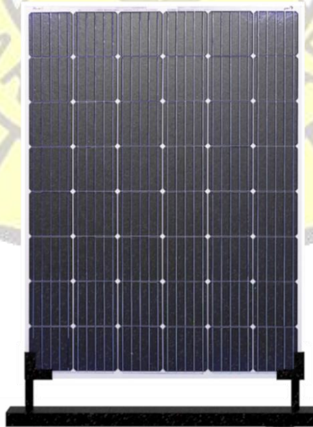
Gambar 1. Panel surya tipis JLeaf mono kristalin 255 Wp [14].

Panel surya tipis yang digunakan pada sistem PLTS Atap yang dibahas adalah panel surya memakai lapisan kaca tipis dengan tebal kaca 2.0 mm dan tanpa memakai frame yang terbuat dari alumunium. Kaca tipis yang digunakan ini akan menghasilkan transmisi sinar gelombang surya yang lebih sempurna dan memiliki berat massa yang lebih ringan.[12]. Panel surya tipis ini akan mempunyai umur pakai 25 tahun di mana selama umur pakai, panel tersebut akan menghasilkan listrik lebih dari 80 % kapasitas yang tertulis pada label spesifikasi [13]. Spesifikasi panel surya tipis tanpa frame mono kristalin 255 Wp 31 Volt mempunyai berat 6 kg seperti terlihat pada gambar 2. Spesifikasi yang sebanding untuk kapasitas yang sama mono kristalin 250 Wp 31 volt dengan frame mempunyai berat 15 kg.