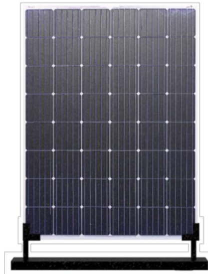
Gambar 1. Panel surya tipis JLeaf mono kristalin 255 Wp [14].

Panel surya tipis yang digunakan pada sistem PLTS Atap yang dibahas adalah panel surya memakai lapisan kaca tipis dengan tebal kaca 2.0 mm dan tanpa memakai frame yang terbuat dari aluminium. Kaca tipis yang digunakan ini akan menghasilkan transmisi sinar gelombang surya yang lebih sempurna dan memiliki berat massa yang lebih ringan.[12]. Panel surya tipis ini akan mempunyai umur pakai 25 tahun di mana selama umur pakai, panel tersebut akan menghasilkan listrik lebih dari 80 % kapasitas yang tertulis pada label spesifikasi [13]. Spesifikasi panel surya tipis tanpa frame mono kristalin 255 Wp 31 Volt mempunyai berat 6 kg seperti terlihat pada gambar 2. Spesifikasi yang sebanding untuk kapasitas yang sama mono kristalin 250 Wp 31 volt dengan frame mempunyai berat 15 kg.