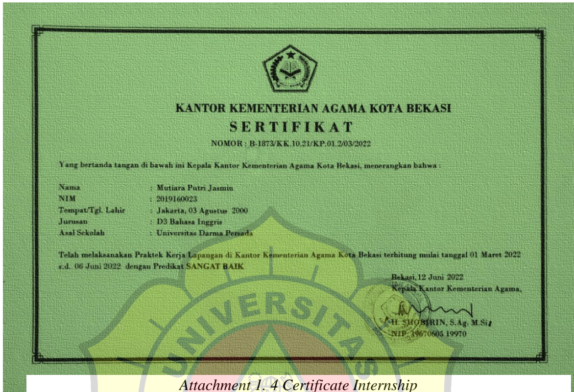
Attachment 1. 4 Certificate Internship