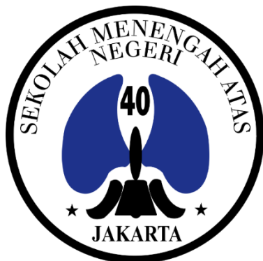
Gambar 2.1 Logo SMAN 40 Jakarta Utara