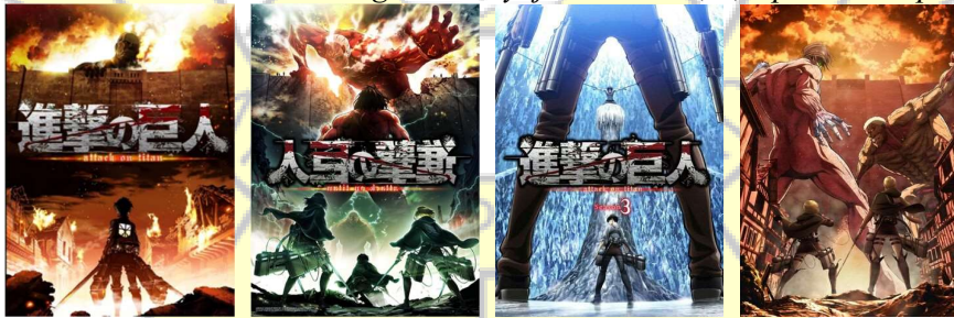
Gambar 18. Poster Anime Shingeki No Kyojin Season 1, 2, 3 part 1 dan part 2

( https://attackontitan.fandom.com/wiki/Attack_on_Titan_(Anime) )