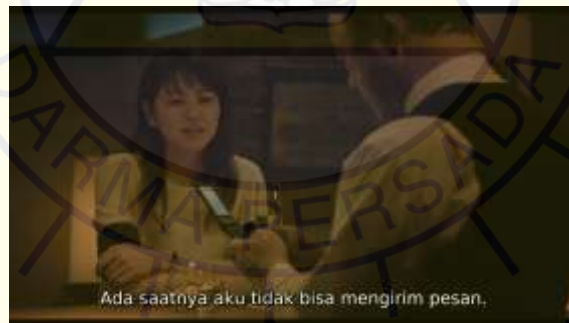
Gambar 3 The G bar

Setelah 8 tahun berlalu sejak kecelakaan Haruta, Kanna masih mempunyai rasa trauma menggunakan fitur pesan di handphone karena masih terbayang pesan yang dikirim oleh Haruta sebelum ditabrak mobil truk. Kanna pun menceritakan traumanya kepada pelayan di The G Bar , ketika Kanna tidak bisa menggunakan fitur pesan di handphone -nya.