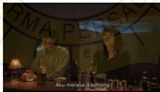
Gambar 10 The G Bar

Roku yang langsung meminta maaf kepada Kanna karena sudah mengetahui tentang Haruta bukan dari Kanna. Kanna marah terhadap