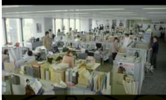
Gambar 4 Perusahaan Komik Sumber Kiyoku Yawaku 05:27

Pada latar sosial pada film Kiyoku Yawaku adalah masyarakat yang bekerja di sebuah perkantoran di Jepang sangat pekerja keras. Salah satu yang menunjukkan masyarakat Jepang kerja keras terdapat pada film Kiyoku Yawaku .