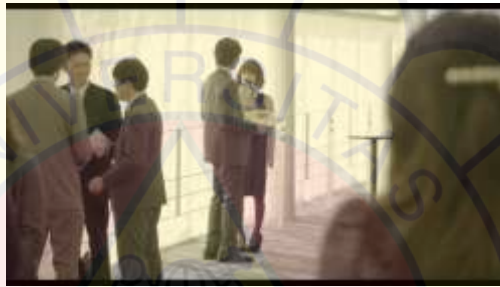
Gambar 1 festival film

Kanna cemburu melihat kedekatan hubungan Roku dan teman komikusnya yang bernama Nohara. Kanna melihat Roku yang sedang bersama dengan Nohara disebuah festival film.