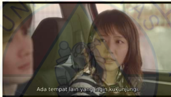
Gambar 5 Kanna minta tolong kepada Roku

Kanna : Akazawa... Roku : Hmm... Kanna : Ada tempat yang ingin aku kunjungi.