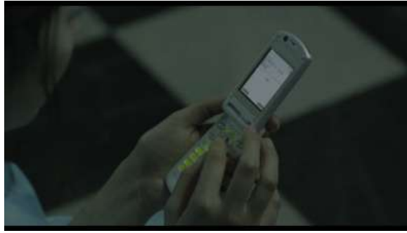
Gambar 2 Kanna sedang membaca pesan masuk dari Haruta

Tomomi mendorong Kanna sampai terjatuh dan Kanna pun langsung melihat pesan di handphone -nya, isi pesan tersebut “いっよ(Aku pergi)” yang dikirim oleh Haruta sebelum ditabrak mobil truk. Kanna yang melihat pesan dari Haruta langsung mengalami syok.