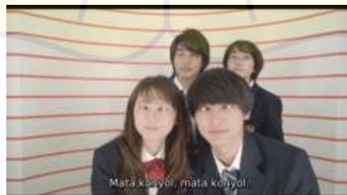
Gambar 4 Photo Box