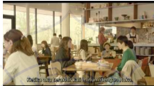
Gambar 9 Restoran