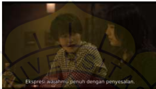
Gambar 11 The G Bar Sumber Kiyoku Yawaku menit 48:12