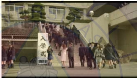
Gambar 1 SMA di Kota Higashiyama

SMA ini adalah tempat sekolah Kanna dengan Haruta. Awal masuk SMA Kanna dan Haruta pergi terburu-buru karena kesiangan berangkat ke sekolah, Kanna dan Haruta pun harus terburu-buru keluar dari apartemen.