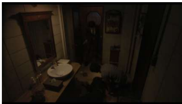
Gambar 12 The G Bar

Kanna merasa kesal mendengar pernyataan dari Roku langsung minum alkohol. Pada saat itu Kiyosama ketemu Roku secara tidak disengaja di sebuah bar, Kiyosama pun langsung menyapa Roku. Kanna langsung pergi ke kamar mandi dan pingsan di kamar mandi. Roku pun langsung panik pergi ke kamar setelah mendengar ada yang jatuh dari kamar mandi.