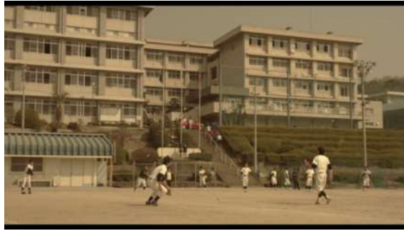
Gambar 6 SMA di Kota Higashiyama

Setelah datang ke SMA di kota Higashiyama, Kanna pun mengingat semua kenangan bersama Haruta. Dari teori milik Hatta, gejala pengalaman berulang atau memori yang menyangkut peristiwa trauma adalah saat Kanna langsung menangis sedih karena Kanna merindukan sosok Haruta. Kanna melihat coretan gambar dinosaurus yang dibuat oleh Haruta di lorong apartemen tempat tinggal Haruta dan Kanna dulu.