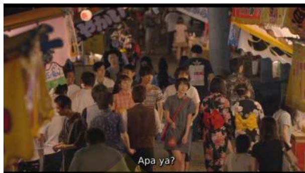
Gambar 3 Festival Hanabi

Akhirnya Haruta pun menyetujui pendapat Kanna yang ingin makan kakigori (es serut). Haruta, Kanna, Tomomi dan Mayama pergi membeli kakigori . Mereka berempat pun terlihat bahagia pergi ke festival hanabi bersama.