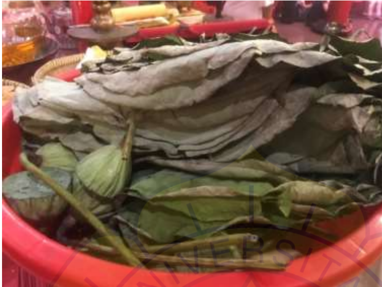
Baskom Ramuan Herbal ke-1