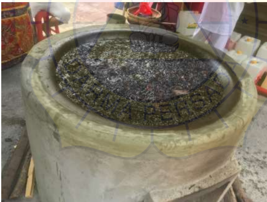
Minyak yang dimasak dengan ramuan-ramuan obat