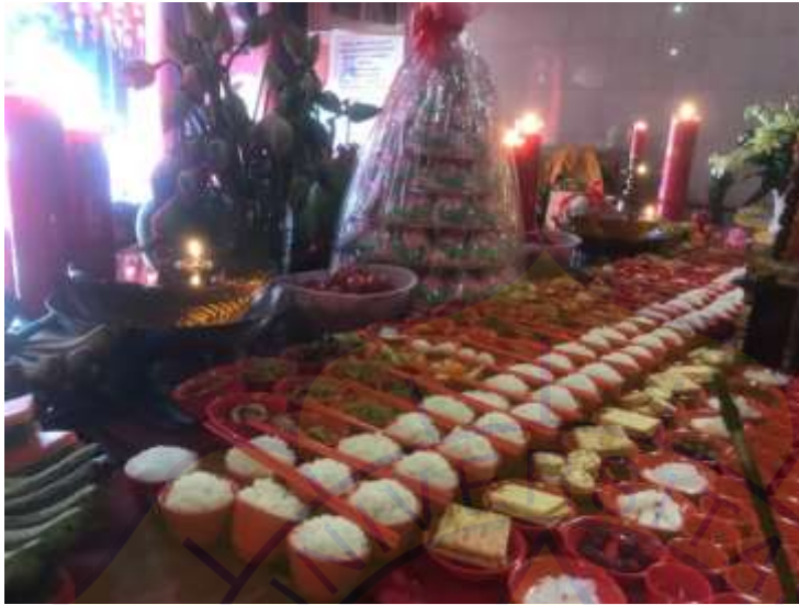
Persembahan makanan pada perayaan ulang tahun Dewa Lo Cia