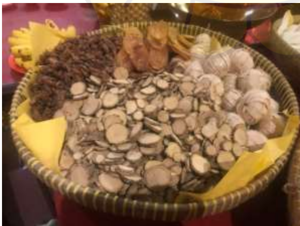
Tampah Bambu Ramuan Herbal Ke-3