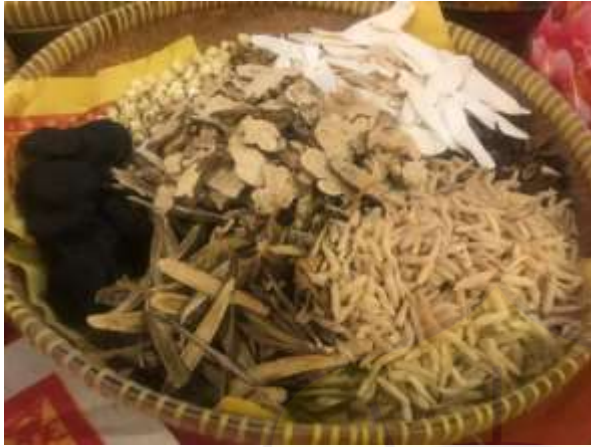
Tampah Bambu Ramuan Herbal ke-1