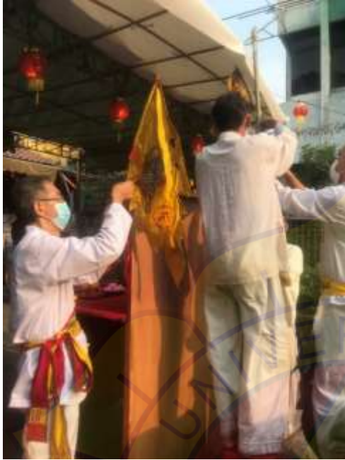
Pemasangan Bendera Naga dan Macan