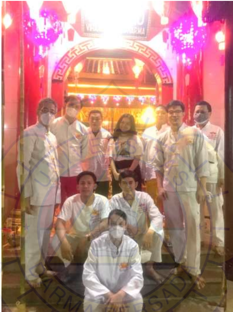
Penulis dan beberapa Anggota Hu Huat Lo Cia Bio Tanggal 14 Oktober 2021 Kampung Duri, Jakarta barat