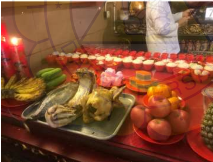
Persembahan makanan pada perayaan ulang tahun Dewa Lo Cia