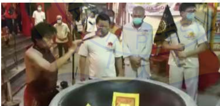
Tangsin memberkati dan memberikan kekuatan pada kualiti yang akan digunakan