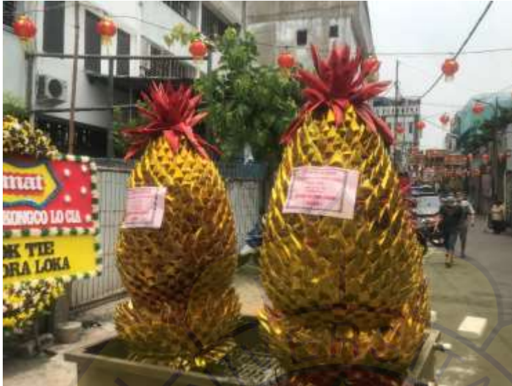
Persembahan kertas emas pada perayaan ulang tahun Dewa Lo Cia