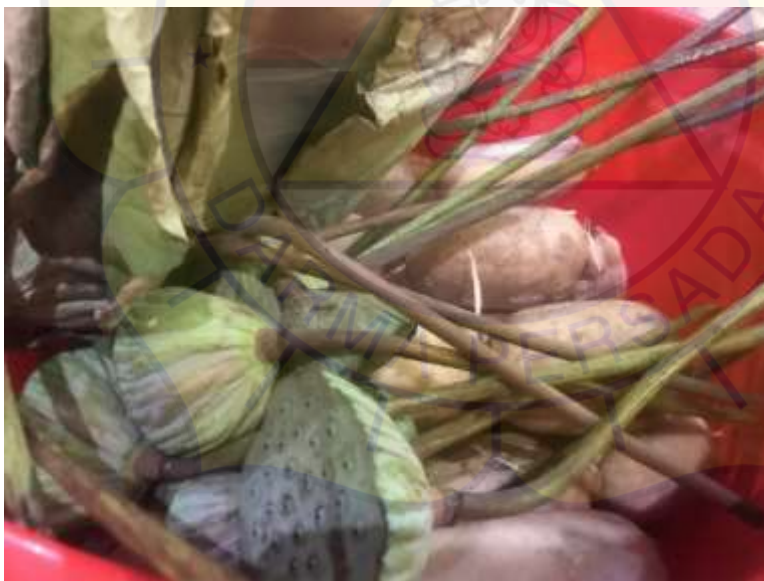
Baskom Ramuan Herbal ke-2