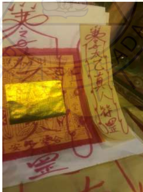
Kertas Hu dengan Nama Dewa-Dewi