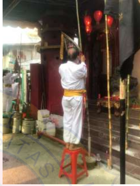
Pemasangan Bendera Lima Penjuru