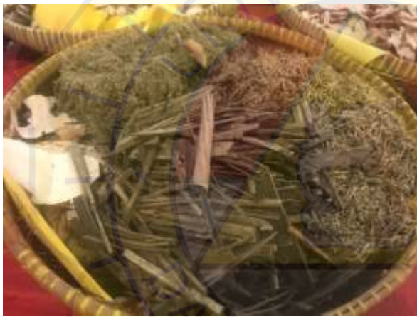
Tampah Bambu Ramuan Herbal ke-2