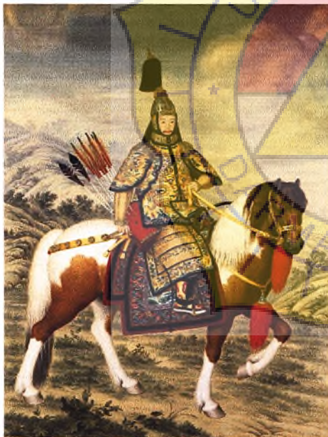
Gambar 3 : Qianlong berkuda dengan baju perang.