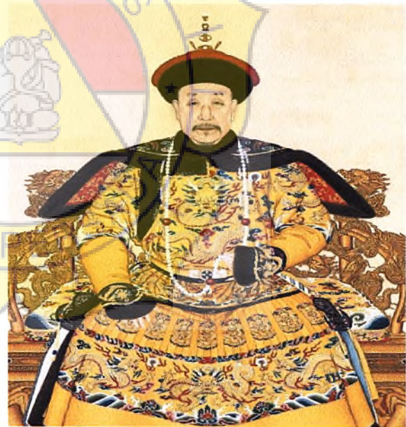
Gambar 4 : Qianlong di usia senja.