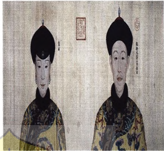
Gambar 2 : Xiao Xianchun dan Qianlong.