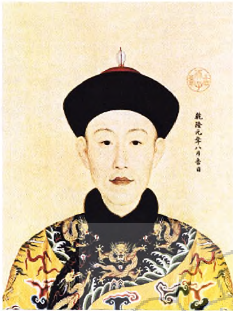
Gambar 1 : Qianlong muda.