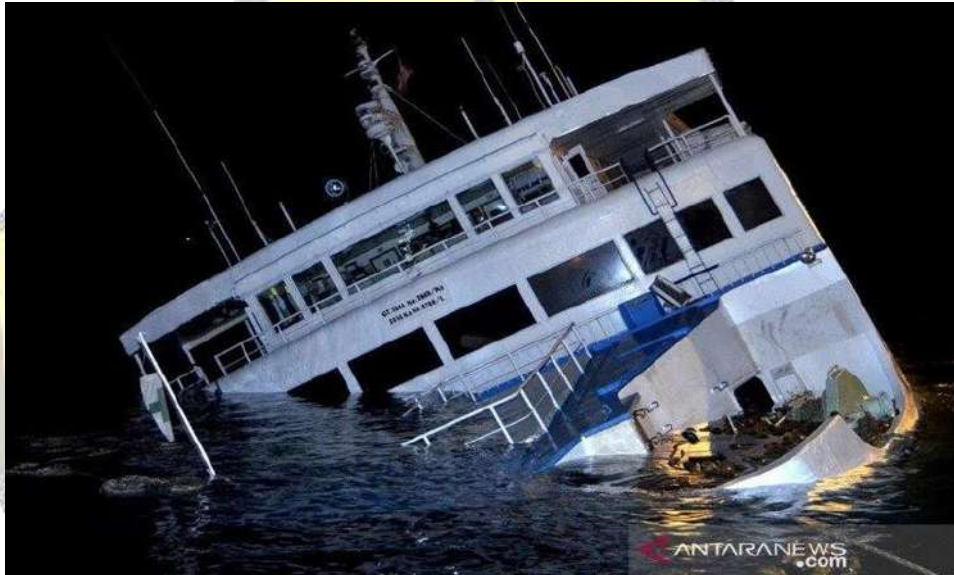
Gambar 1. Kecelakaan Kapal