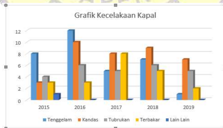
Gambar 3. Grafik kecelakaan kapal

Tujuan pertama dapat dilalukan dengan kombinasi kreatif dan analisa yang bertujuan untuk mengidentifikasi semua bahaya yang relevan. Dalam proses ini, tujuan utamanya adalah untuk mengidentifikasi sebab dan akibat kecelakaan dan bahaya [9].