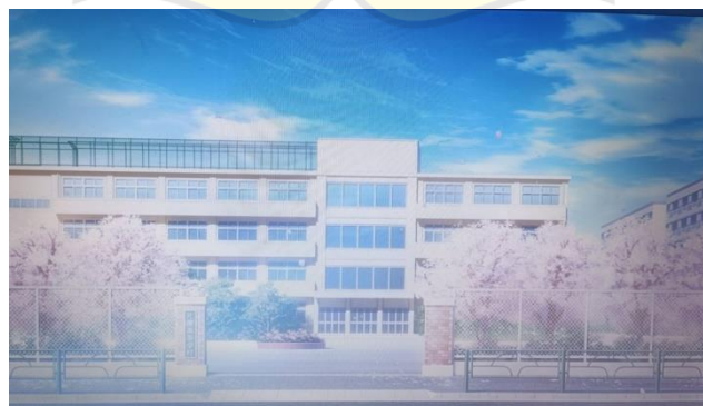
Gambar 9 Sekolah Katagiri episode 3