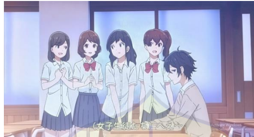
Gambar 14 Peningkatan konflik episode 6

Tahapan ini merupakan konflik sebelumnya yang berkembang dan situasinya menjadi menegangkan.