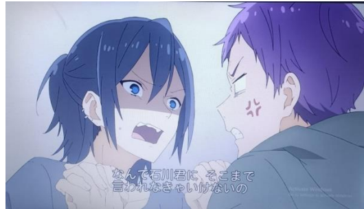
Gambar 12 Perkelahian Miyamura dan Toru episode 3

Tahapan yang merupakan awal timbulnya suatu konflik, yang berkembang menjadi konflik lainnya.