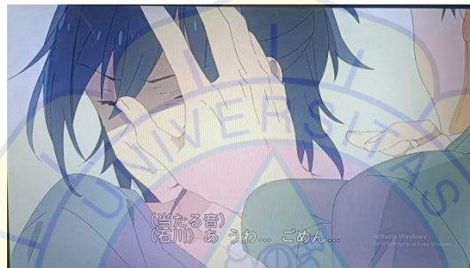
Gambar 13 Perkelahian Miyamura dan Toru episode 3