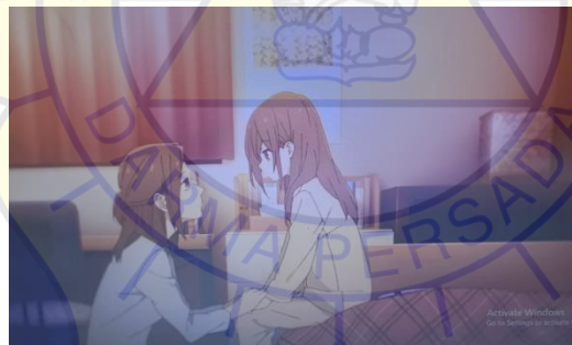
Gambar 3 Yuriko pekerja keras

Pada kutipan di atas, Ibu Hori yang bernama Yuriko, menelpon Hori pada saat membersihkan rumah. Yuriko menyuruh Hori untuk menyiapkan makan malam, karena Yuriko tidak dapat pulang ke rumah disebabkan harus lembur dalam pekerjaannya.