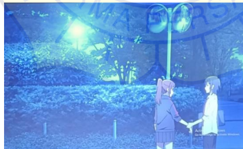
Gambar 8 Taman episode 5