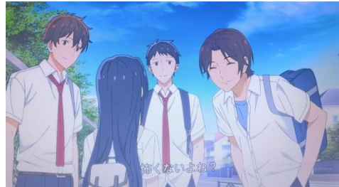
Gambar 4 Sawada takut laki-laki episode 6

Takut dapat diartikan sebagai rasa cemas terhadap sesuatu yang dianggap membahayakan. Dalam bahasa Jepang, takut dapat diartikan sebagai 怖い ( kowai ) yang artinya perasaan khawatir terhadap hal yang berbahaya yang akan sedang terjadi dan berusaha menghindarinya.