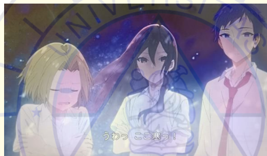
Gambar 15 Peningkatan konflik episode 6

女子生徒 1 : 宮村君 どうして髪切ったの? 宮村 : え?いや夏だし... 女子生徒 2 : 夏だからだつてさ 女子生徒たち : へえ〜 女子生徒 3 : ねえなんでいつも冬服なの? 宮村 : さ寒がりです。 女子生徒 4 : ピアスの穴 すごーい! 女子生徒 1 : いつ開けたの? 宮村 : 中学... 女子生徒 2 : おうち、ケーキ屋なんでしょ? 宮村 : すげえ... 氷の女王みたいになってる 女子生徒 3 : うっ……なんだか寒いね。.. 女子生徒 4 : ああたしも... 透 : たぶん今だけだつて 堀 : は? 何?なんのこと? 由紀 : うわっ ここ寒っ!