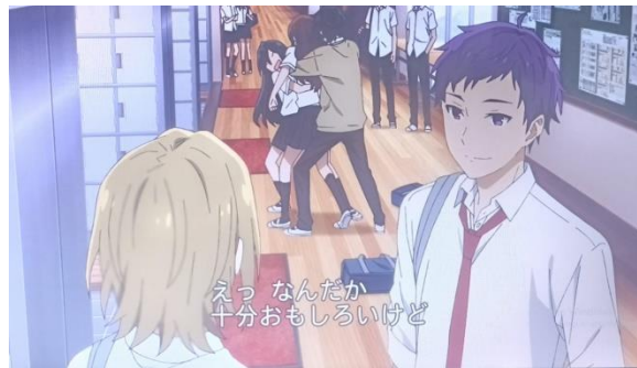
Gambar 16 Klimaks episode 6