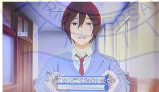
Gambar 1 Hori suka membantu episode 2

Membantu dapat diartikan sebagai memberikan pertolongan kepada orang yang membutuhkan. Dalam bahasa Jepang, membantu diartikan 手伝う ( tetsudau ) yaitu membantu seseorang dalam mengerjakan suatu pekerjaan.