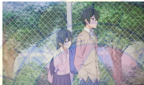
Gambar 5 Sawada takut laki-laki episode 6