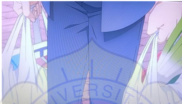
Gambar 2 Miyamura Rendah Hati episode 2

Pada kutipan di atas, menunjukkan kerendahan hati Miyamura karena ia memikirkan kesenangan untuk adiknya Hori yang bernama Sota, dengan membelikannya buku gambar.