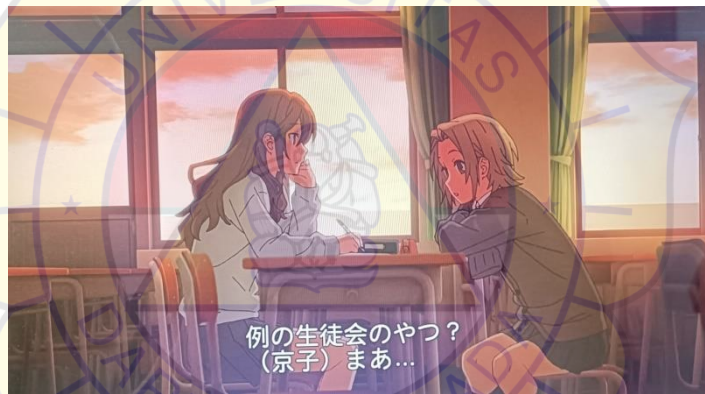
Gambar 7 Ruang kelas episode 2