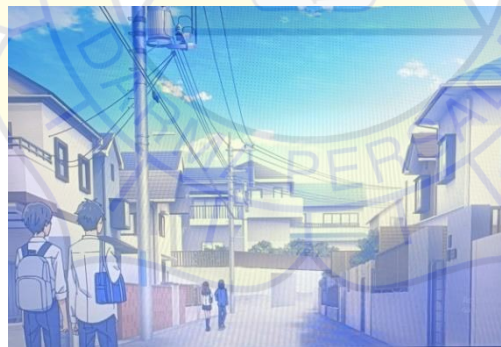
Gambar 6 Pagi hari di depan rumah Hori