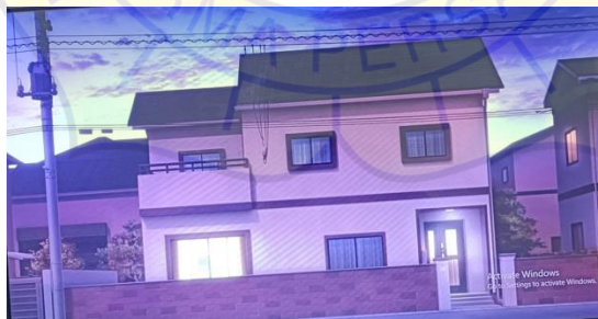
Gambar 10 Rumah Hori episode 1