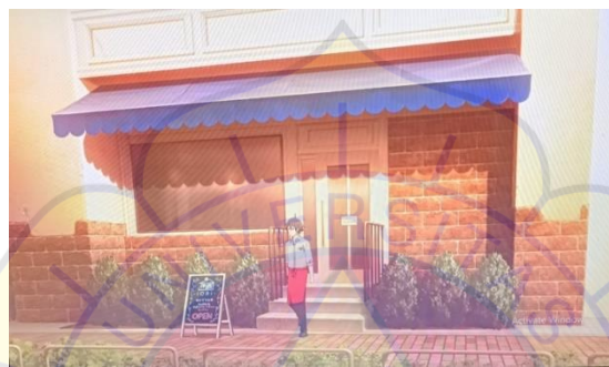
Gambar 11 Toko Iori episode 9