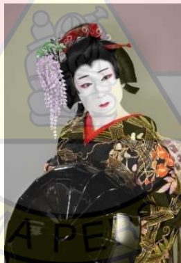
Gambar 2.3 女形 ( Onnagata ) pada 歌舞伎 ( Kabuki )