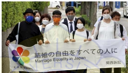
Gambar 2.2 Aktivis LGBT Jepang yang meminta penyetaraan hak pernikahan

( https://api.time.com/wp-content/uploads/2022/06/japan-lgbtq-rights.jpg )