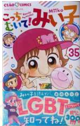
Gambar 1.3 Sampul manga “Kocchi Muite! Miiko” jilid ke-35 cetakan pertama

( https://images.tokopedia.net/img/cache/500-square/hDjmkQ/2022/10/25/bf52e476-6bc8-4502-b74d-328786861a75.jpg )