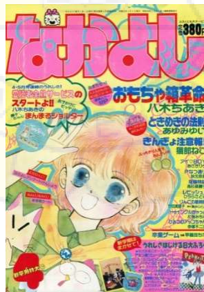
Gambar 1.1 Majalah なかよし ( Nakayoshi ) edisi April 1989

( https://missdream.org/wp-content/uploads/2017/08/nakayoshi198904.jpg )