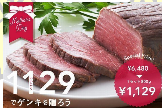
Gambar 4 Goroawase dalam iklan penjualan daging premium pada hari Ibu.