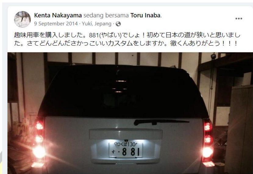
Gambar 3 Goroawase dalam bahasa gaul oleh native Jepang.