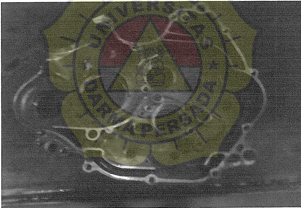
Lampiran III : Cankcase Comp RH typ XB97*