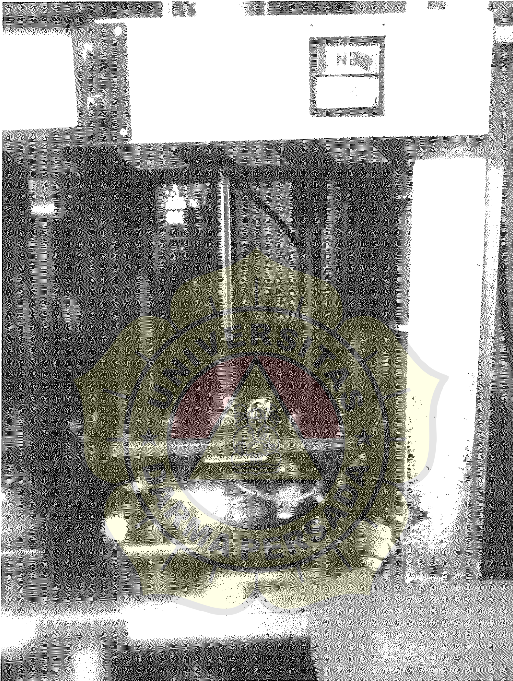
Lampiran IV : Proses Leak Tester Cankcase Comp RH type XB97* untuk mengetahui Kebocoran