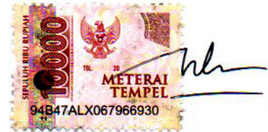
Indira Putri Ambarwati