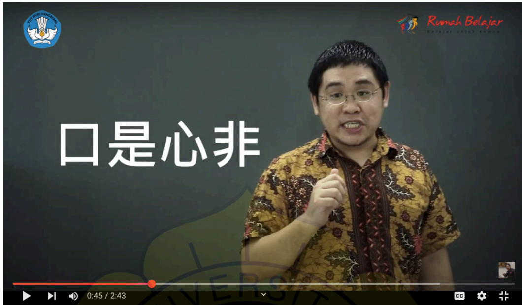
Gambar 5: Video pembelajaran – biaya pembuatan mahal dan waktu yang digunakan juga sangat banyak

Seiring waktu berjalan dan kemajuan teknologi, pada 2019 akhir penulis bertemu dengan seorang teman seprofesi yang notabene Alumni Universitas Darma Persada yang mengenalkan platform pembelaran digital Quizlet saat mengikuti diklat guru bahasa Mandarin nasional. Platform ini gratis dan ramah digunakan di perangkat yang spek-nya tidak terlalu tinggi, namun perlu melakukan pendaftaran akun dan memilih nama pengguna. Meskipun ada fitur acak soal dan acak jawaban, namun platform tersebut pada saat itu belum memiliki fungsi dan mode yang kompetitif; begitu juga platform-platform yang penulis kenal, pelajari, dan pakai pada saat pandemi; seperti: Wordwall, Baamboozle maupun Live Worksheet.