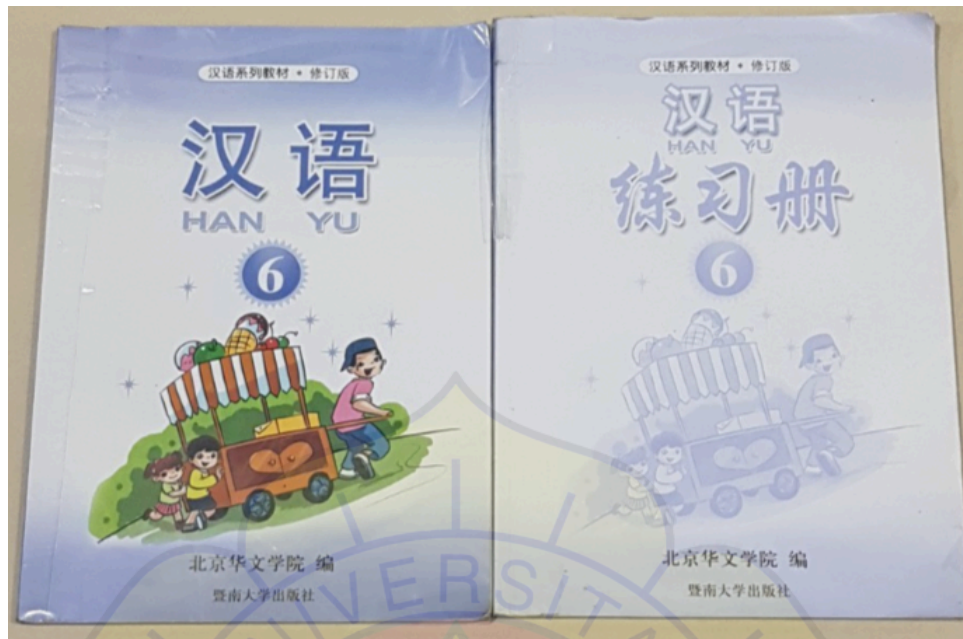
Gambar 3: Buku Cetak Bahasa Mandarin Han Yu 6 dan Buku Latihannya

Di SMP St. Patricia Tangerang, siswa kurang tertarik pada mata pelajaran Bahasa Mandarin, khususnya pada kosakata dan tata Bahasa. Hal ini memperlihatkan urgensi pembaharuan metode pengajaran. Salah satu penyebabnya adalah keputusan dan kebijakan manajemen yang secara tidak langsung membuat tenaga pengajar Bahasa Mandarin berganti hampir setiap tahun ajaran.